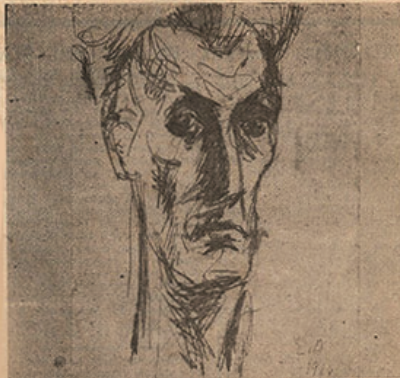
Αυτοπροσωπογραφία του Στρατή Δούκα, έργο του 1934

ΟΦΕΙΛΕΣ ΣΕ ΔΥΟ ΜΕΓΑΛΕΣ ΦΥΣΙΟΓΝΩΜΙΕΣ ΤΗΣ ΤΕΧΝΗΣ ΚΑΙ ΤΩΝ ΓΡΑΜΜΑΤΩΝ ΜΑΣ